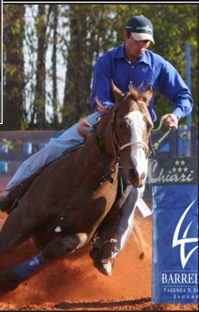
Irmão VICTORY FLY VM