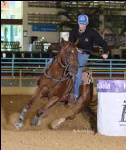
Treinada para Três Tambores. Cernelha 1,47.