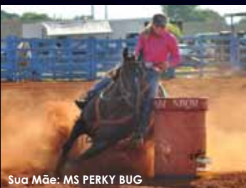
Sua Mãe: MS PERKY BUG