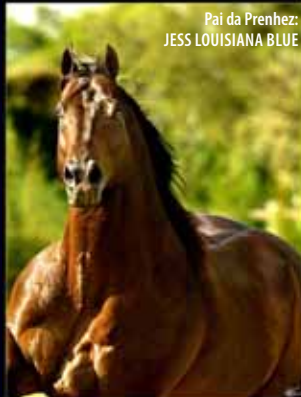
Pai da Prenhez: JESS LOUISIANA BLUE

Cernelha 1,46. P+ JESS LOUISIANA BLUE de 12/11/2014.