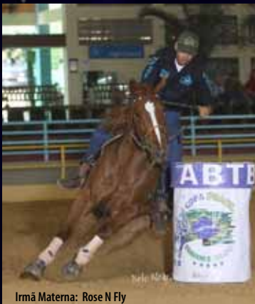
Irmã Materna: Rose N Fly