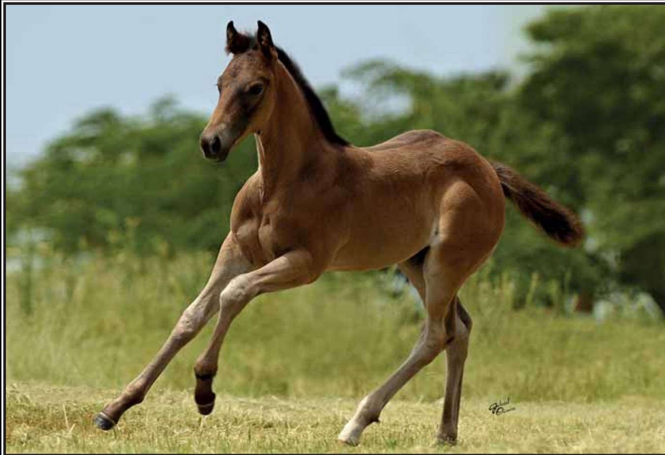
Seu pai: DASH TA FAME

DASH FOR CASH FIRST PRIZE ROSE DASH TA FAME FIRST DOWN DASH SUDDEN FAME TINYS GAY BAR DEARIE DASH FOR CASH PERKS MS PERKY BUG DASH FOR PERKS MS WAHINI BUG BUGS ALIVE IN 75 WAHINI