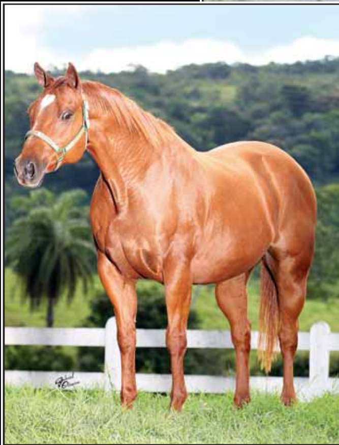
Sua mãe SIGNED TO LIBERTY AAAT 104