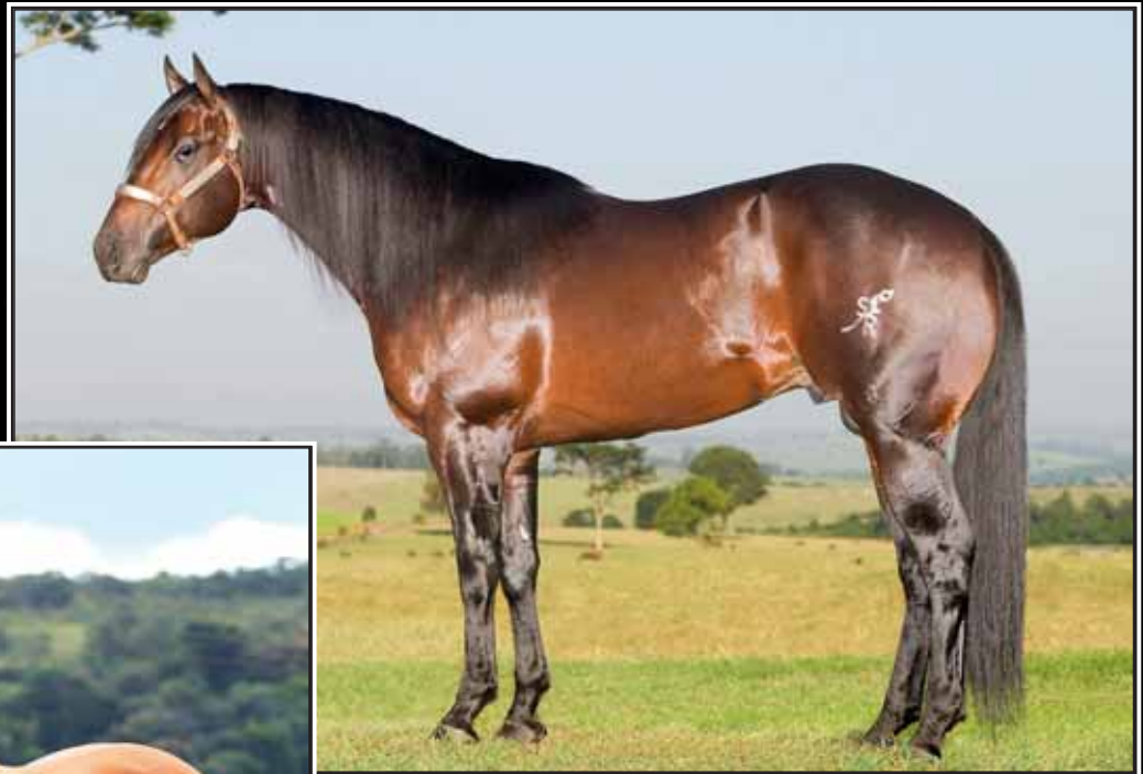
Seu pai AIM TA FAME