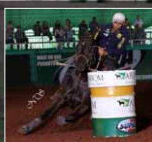
Filho: Glok Beaver 3D