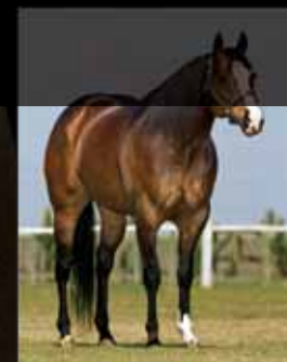
Embrião efetivado em 08/11/14 com Corona Fireball